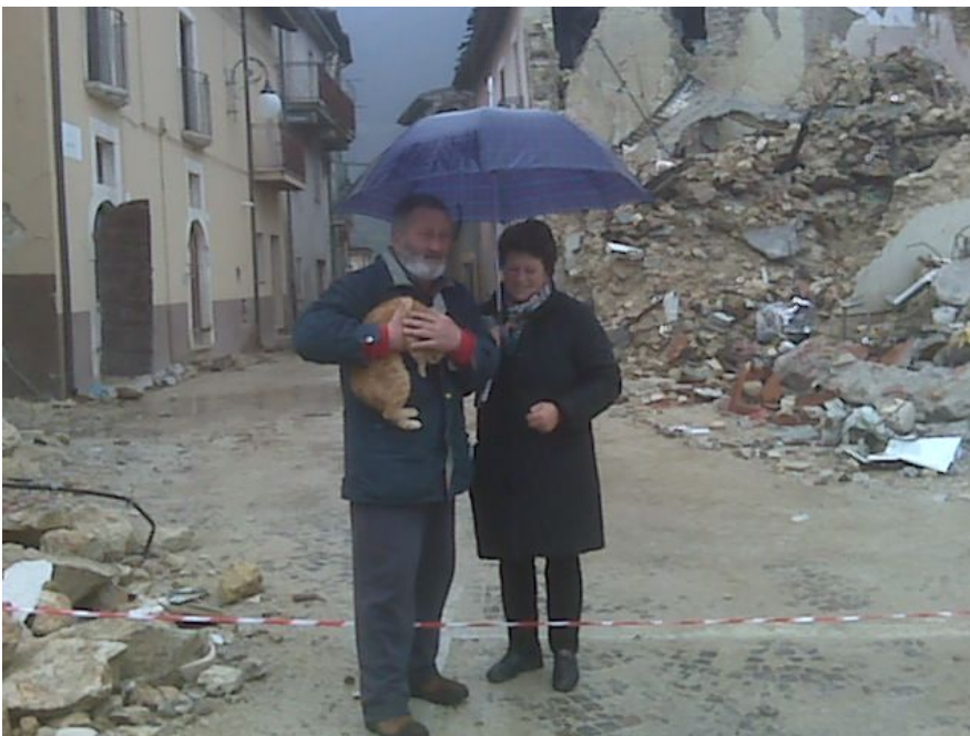
Il proprietario del gatto è in ospedale: i volontari Enpa hanno recuperato il micio e lo hanno consegnato ai parenti dell'uomo