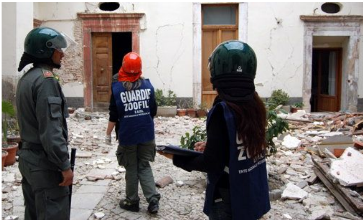
Servizio delle Guardie Zoofile in collaborazione con la Guardia di Finanza, finalizzato alla ricerca di animali in stabili abbandonati

Si avvia gradualmente a soluzione il problema dei parassiti. Continuano ad essere garantiti tutti i servizi di Enpa sia nell'area colpita dal terremoto sia sulla costa. I volontari di Firenze oltre ad aver soccorso e messo in sicurezza alcuni animali da reddito, tra cui due cavalli che pascolavano liberamente, hanno recuperato anche una piccola tartaruga e i pesci di un acquario, miracolosamente intatto dopo i crolli dei giorni scorsi. Per far fronte all'eventuale presenza di altri animali vaganti, i volontari della Protezione Animali stanno continuando a creare alcuni punti di alimentazione sul territorio.